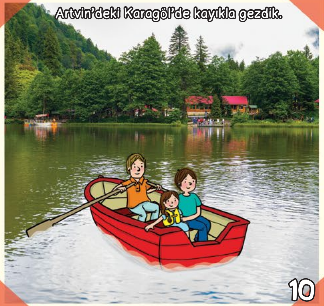
Artvin'deki Karagöl'de kayıkla gezdik.