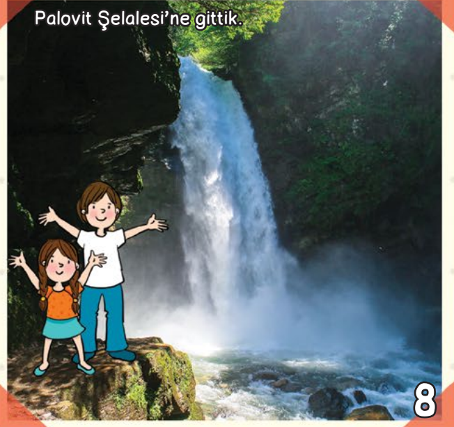
Palovit Şelalesi'ne gittik.