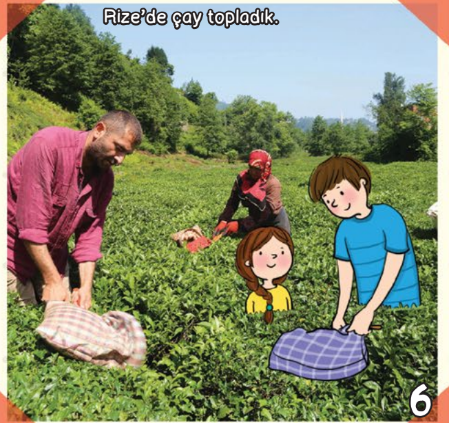
Rize'de çay topladık.