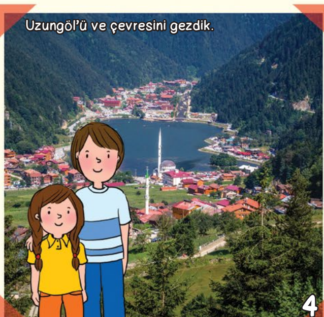
Uzungöl'ü ve çevresini gezdik.