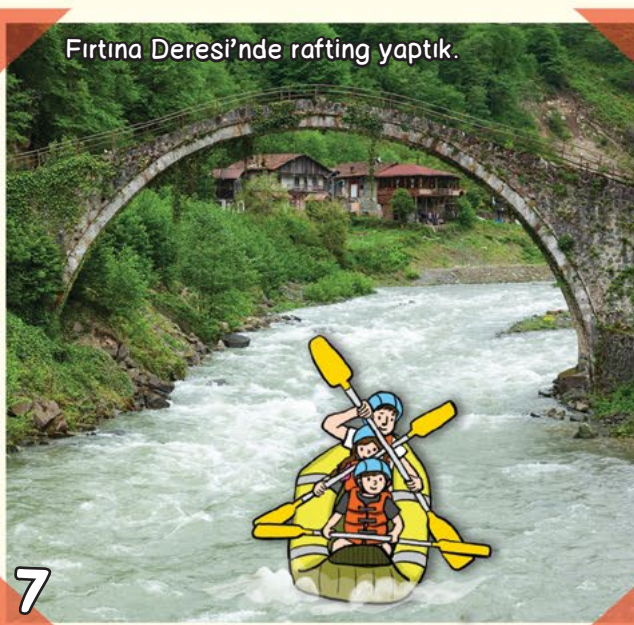
Fırtına Deresi'nde rafting yaptık.