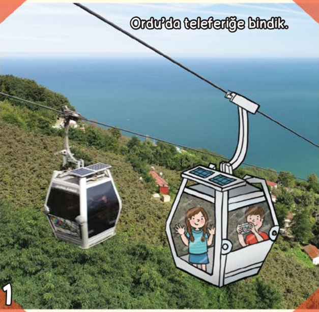
Ordu'da teleferiğe bindik.