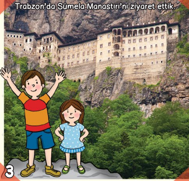
Trabzon'da Sümela Manastırı'nı ziyaret ettik.