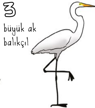
3 büyük ak balıksıl