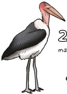
2 marabu leyleği