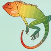
Yeşil orman kertenkelesi